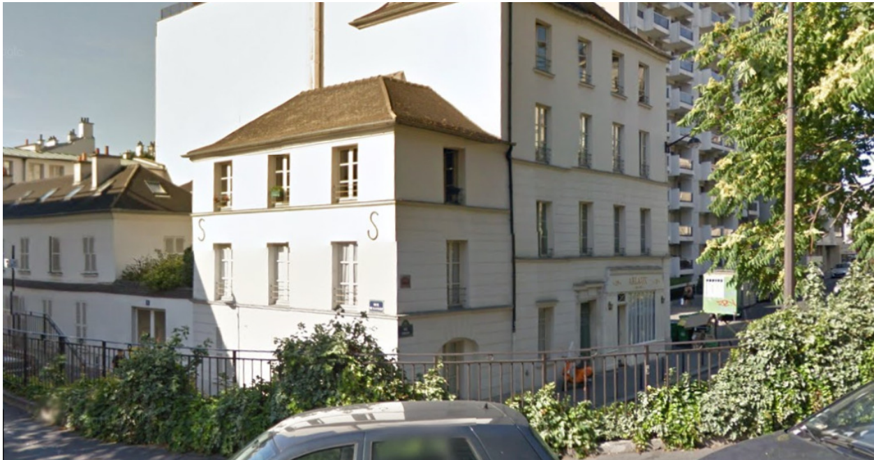
Rue Censier, Paris