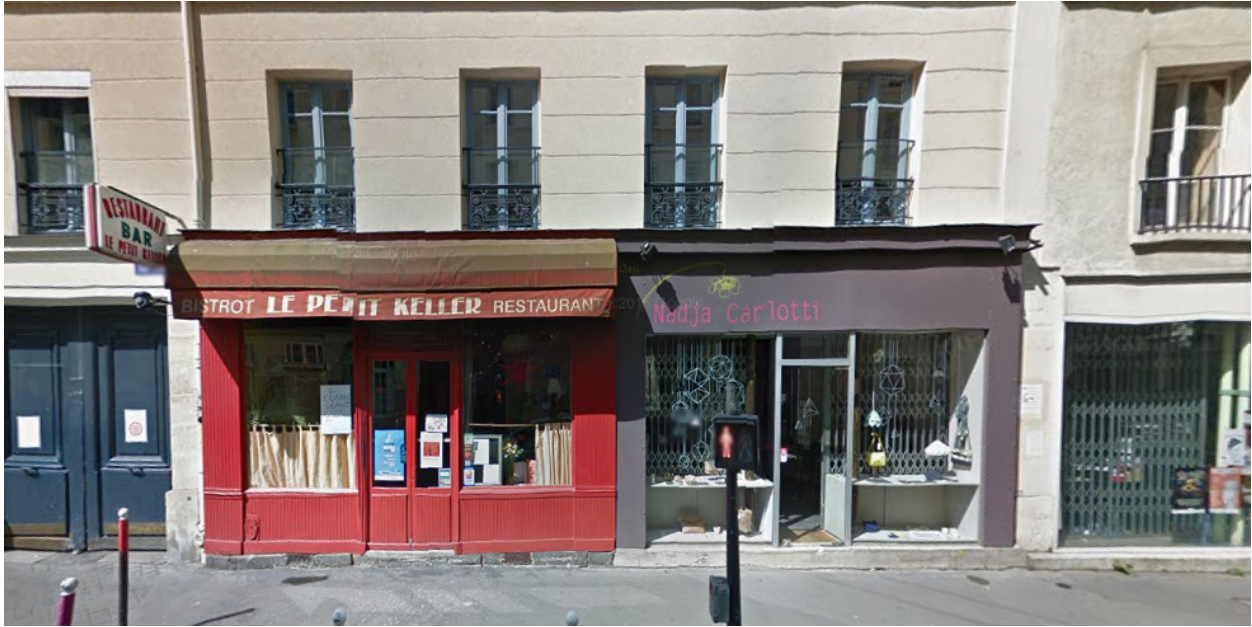
Rue Keller, Paris