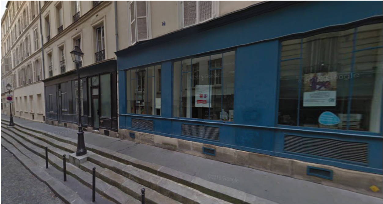
Rue Domat, Paris